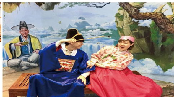
韓服及 骨豐馬金 穿上由現場放置的展示衣，幫大家依照身材挑選傳統的韓服，並在古色古香的場景前照相留念囉！